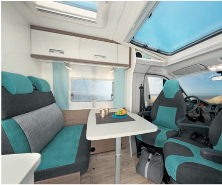
» Faszinierend tiefgründig: Wohnwelt FJORD in kühlem Türkis. Die großen Panoramafenster im Dach setzen die Szenerie serienmäßig ins rechte Licht