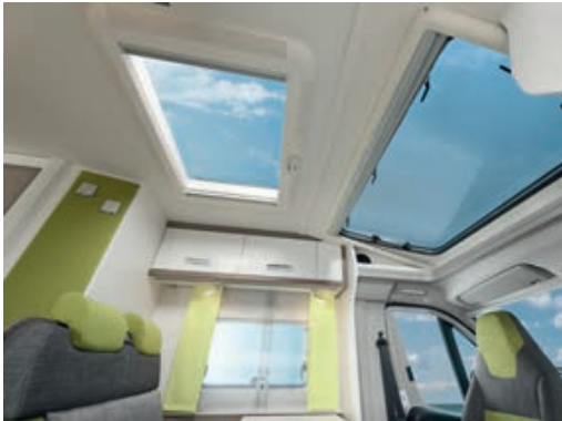
» Panoramafenster bringen Licht und Luft ins Fahrzeug

Der neue Trend ST – Überraschungen sind inklusive!