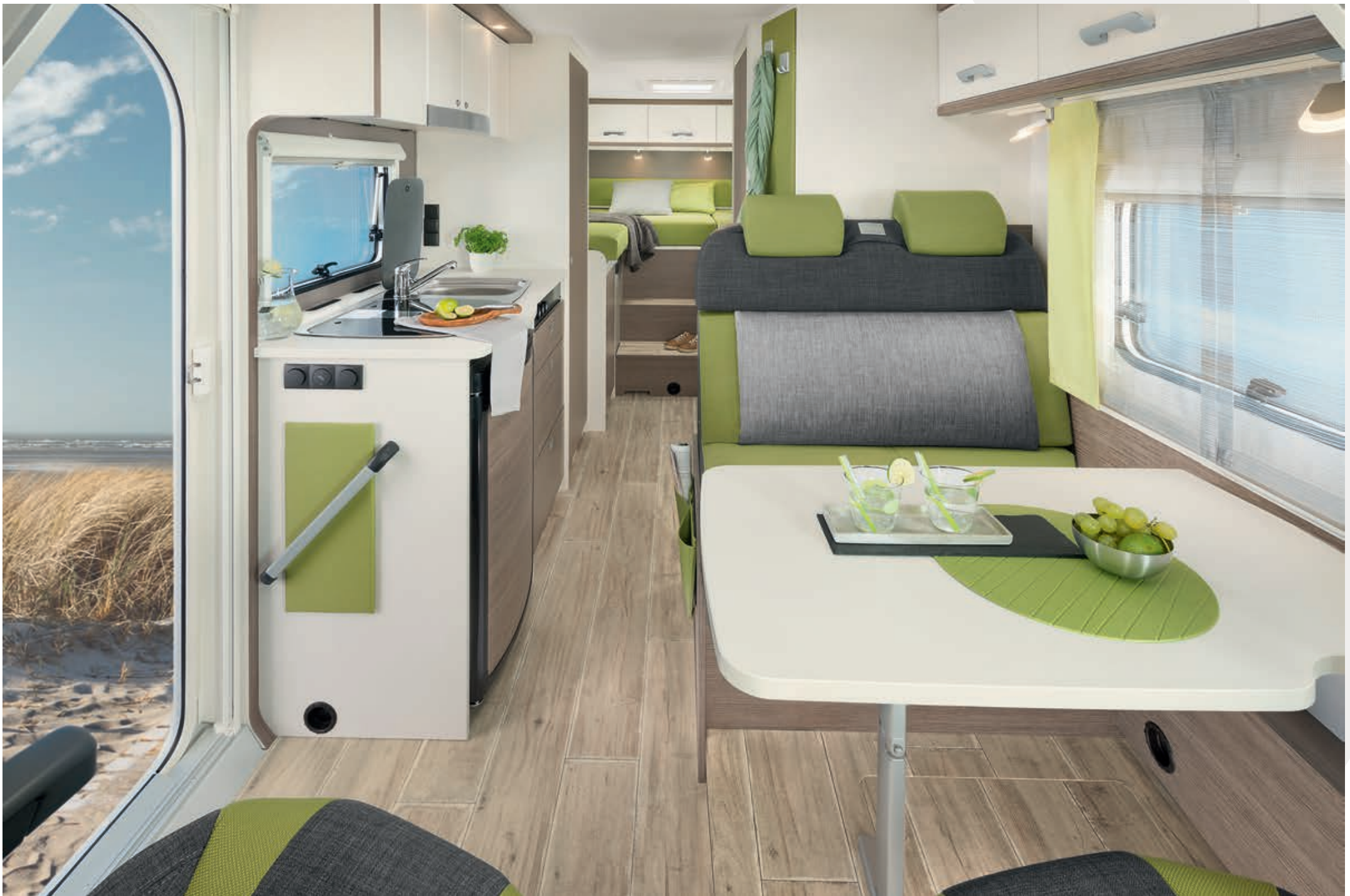
» Wohnwelt Lia: Skandinavisches Wohnflair mit einem klaren, schnörkellosen Design! Im angesagten Vintage-Look präsentiert sich der Bodenbelag