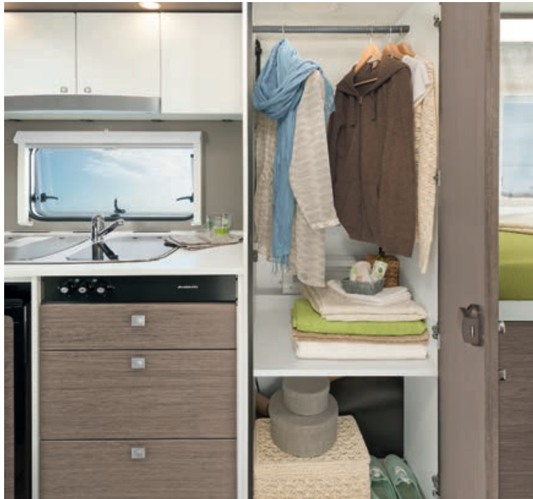
» Da passt was rein: raumhoher Kleiderschrank mit Wäschefach