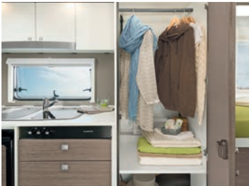
» Da passt was rein: raumhoher Kleiderschrank mit Wäschefach