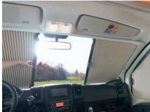
» Die halten dicht: Fahrerhaus-Jalousien schützen vor Kälte, Hitze und neugierigen Blicken