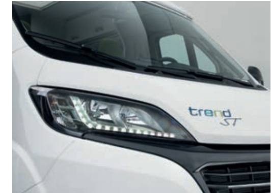
» Blickfang: LED-Tagfahrlicht und schwarze Hochglanz-Kühlerblende