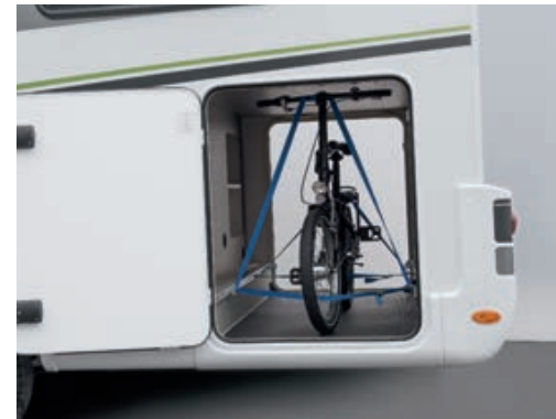
» Dank Dethleffs Heckabsenkung besonders hoch: Heckgarage mit beidseitigem Zugang