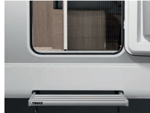
» Praktisch: elektrische Einstiegsstufe und Mückenschutz-Jalousie an der Wohnraumtüre