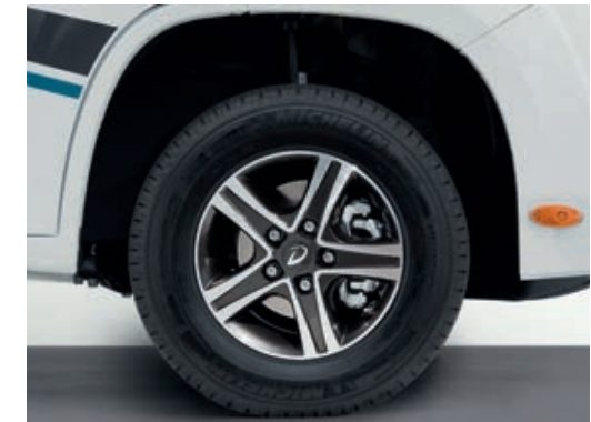
» Schick und gewichtsparend: Alufelgen im Dethleffs Look