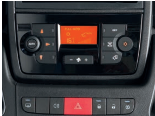
» Sorgt für das richtige Klima: Fahrerhaus-Klimaautomatik