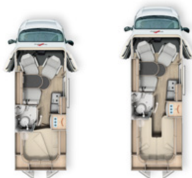
Malibu Van Charming / Malibu Van Charming Coupé