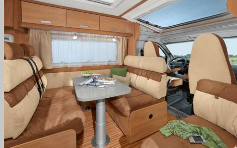
► Während der Fahrt: Bis zu 4 eingetragene Sitzplätze an der Doppeldinette

Als echtes Jubiläumsmodell vereint der EIGHTY 80 Jahre Erfahrung in sich. Die durchdachte Funktionalität werden Sie tagtäglich feststellen. Besonders praktisch sind die mobilen Click-Strahler, die das Licht genau dorthin bringen, wo Sie es benötigen. Oder werfen Sie einen Blick in den Kleiderschrank: Eine Trockenschale im Kleiderschrankboden nutzt die Abwärme der Heizung zum Trocknen von Kleidungsstücken. Gut gelöst ist auch die Verjüngung des Betts im Fußbereich: Nachts setzen Sie einfach ein zusätzliches Polsterelement ein, so dass Sie keine Einschränkung im Schlafkomfort haben.