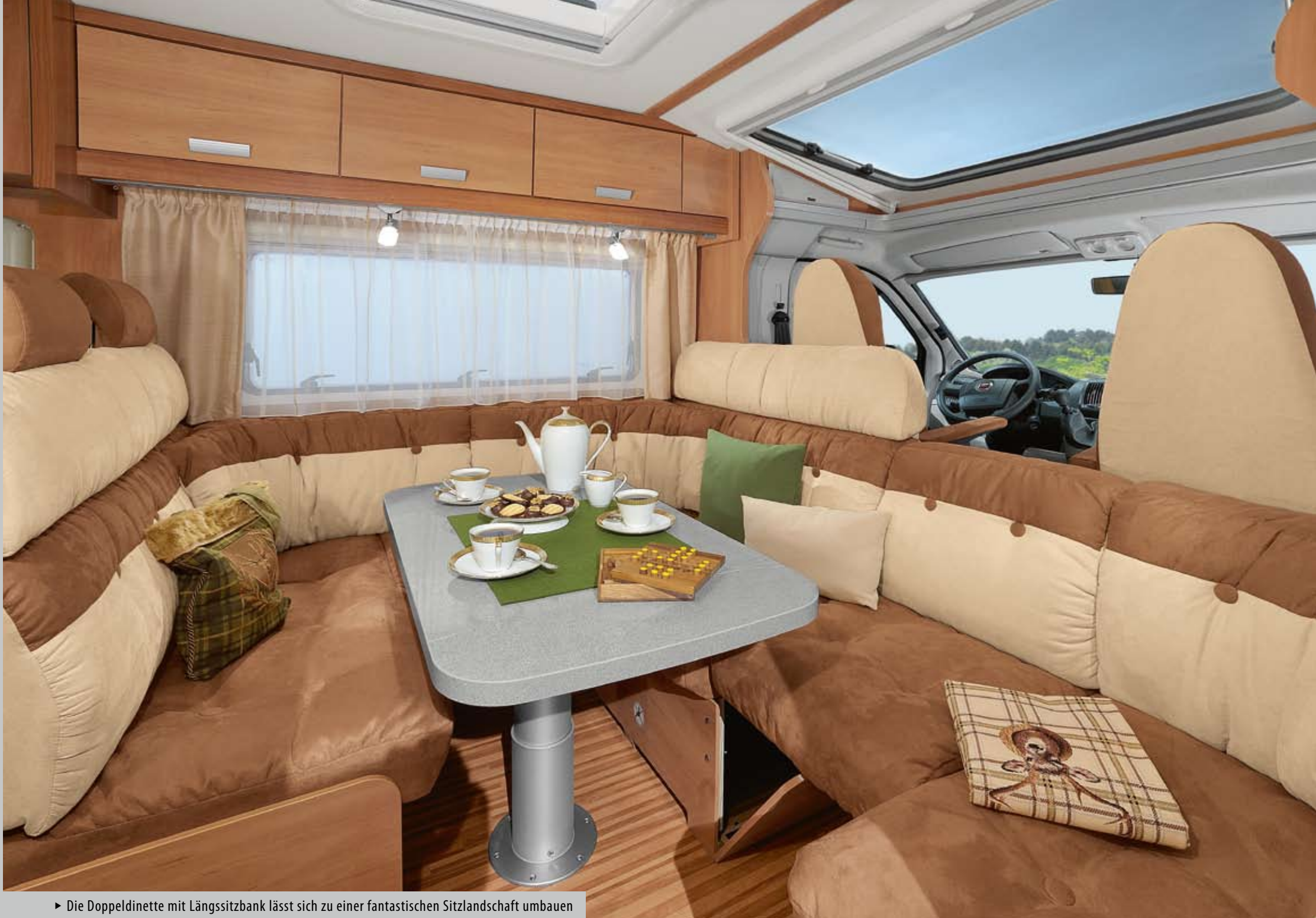
► Die Doppeldinette mit Längssitzbank lässt sich zu einer fantastischen Sitzlandschaft umbauen