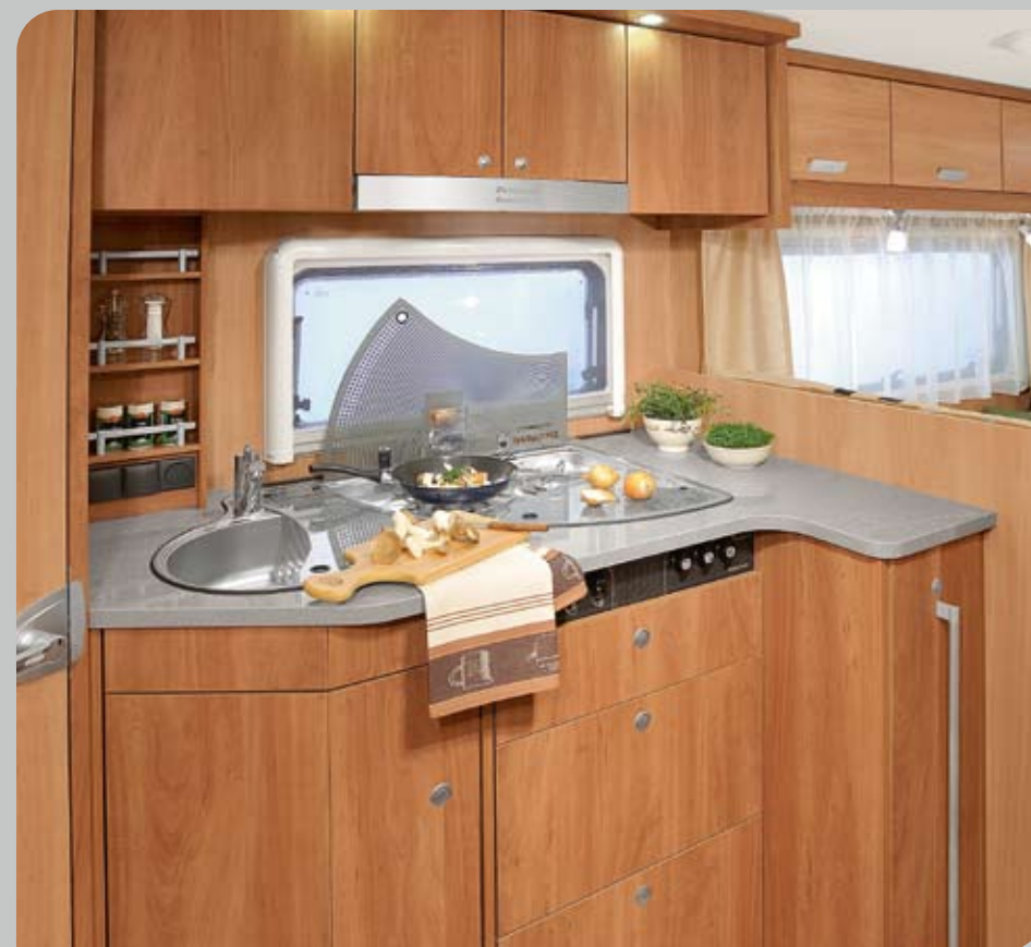
► Komfortables Gourmet-Küchencenter mit großen Schubladen und variabler Kocher-Abdeckung