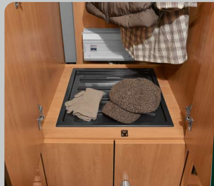
► Praktisch: Trockenschale im Kleiderschrank