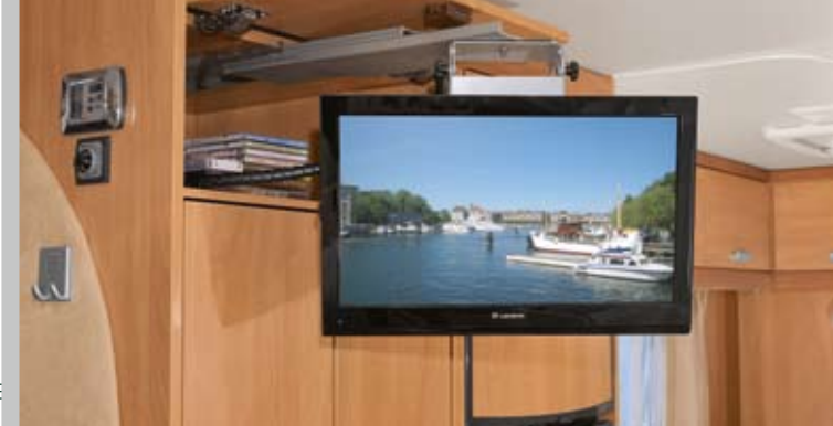
► Komplette Multimedia-Ausstattung im Preis enthalten

* entspricht der Summe der Einzel-Sonderausstattungspreise