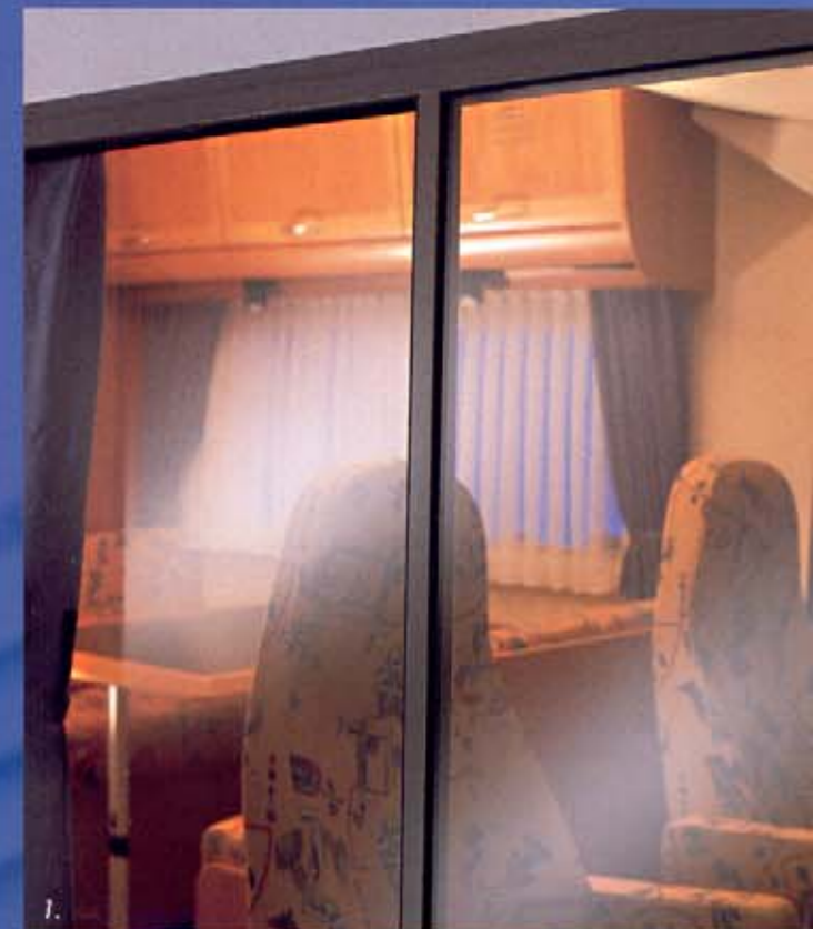
1. Die Fenster aus Doppel-Isol-Glas. 2. Der „Apotheker-Schrank“ in der Küche. 3. Getränke-Parkplatz im Cockpit. 4. Neuartige, leicht erhöhte Möbelkante.

Dazu kommt der neuartige Funktionsboden, in welchem die gesamte Versorgungstechnik sicher untergebracht ist. Auch beim großzügigen Raumangebot und den vielen fortschrittlichen Details der Komfortausstattung wird jedem klar vor Augen geführt, wie innovativ der neue Arto an den Start geht. Wenn Sie jetzt Gas geben, wird Ihnen der Arto dank seines 122 PS starken 2,8-l-Turbodieselmotors auch auf anstrengenden Wegen mit Freude folgen.