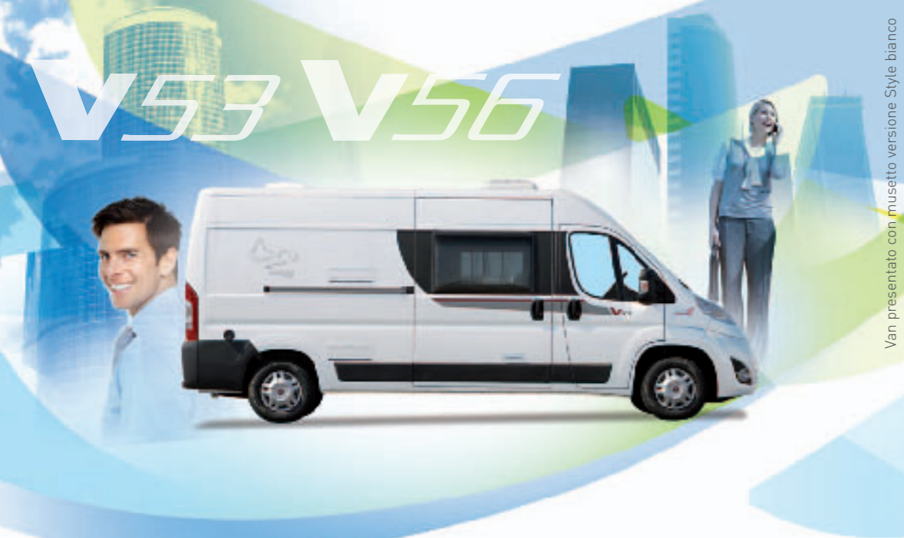
Van presentato con musetto versione Style bianco