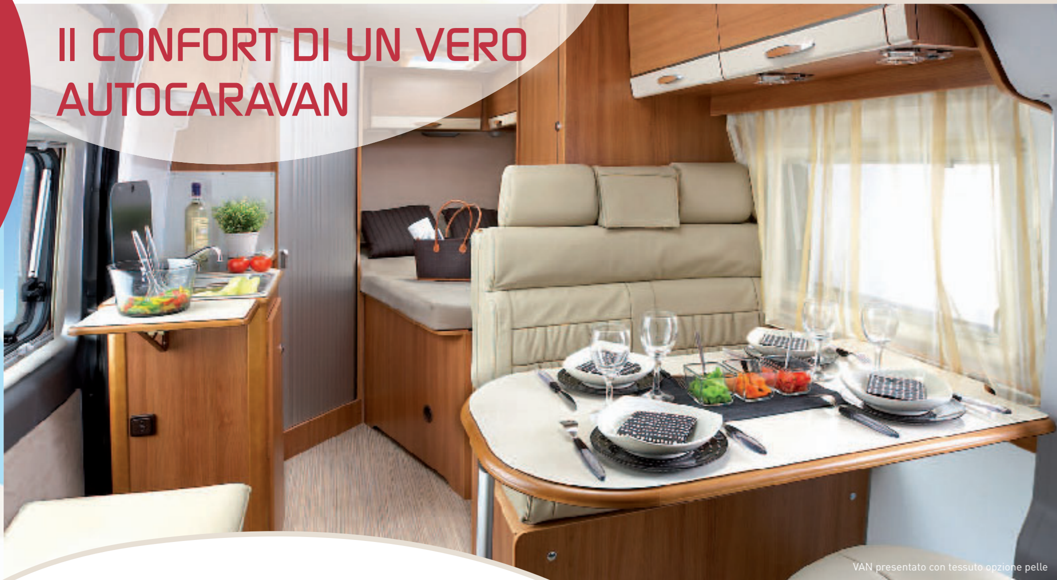
VAN presentato con tessuto opzione pelle

Da più di 50 anni di esperienza nella costruzione di autocaravan, RAPIDO sfrutta tutto il suo know-how in questo nuovo VAN. Il suo guscio in poliestere sposa le più piccole forme interne (isolamento specifico) e permette in questo modo di ingrandire lo spazio. Il risultato è confortevole e funzionale: uno spazio di circolazione perfettamente calcolato ed una disposizione ottimale dei 4 spazi di vita. Approfittate anche di un grande salone a 5 posti conviviale, di una cucina, di 4 posti letto (2 bambini) e di una vera toilette. I mobili HARMONY portano un vento di freschezza all'interno. Aggiungete il vs tocco personale e scegliete uno dei tre tessuti in opzione. Nel momento in cui poserete piede sul gradino elettrico del vostro VAN, vi sentirete subito a casa vostra.